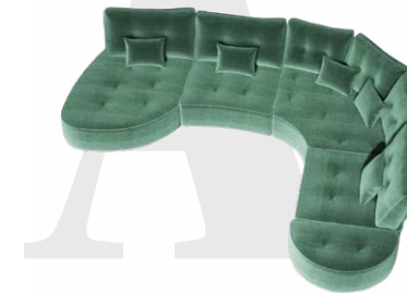
Endelement Hocker „S“