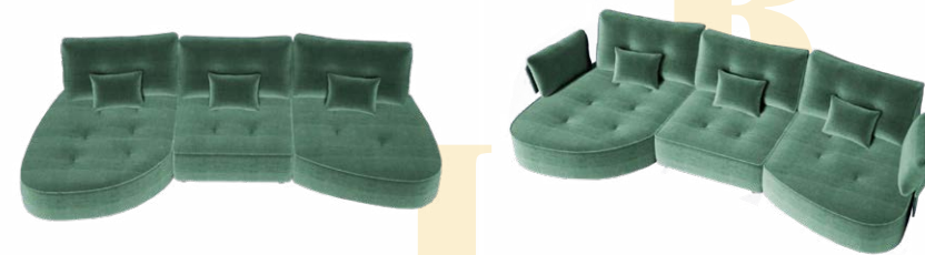
Runde Mittelelemente mit Endelemente (mit oder ohne Arm)