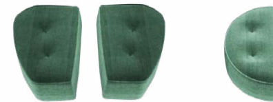
Hocker „PTS1“, „PT2“ und „PS“