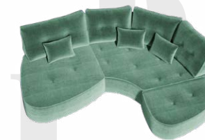
Endelement Hocker „PT1“